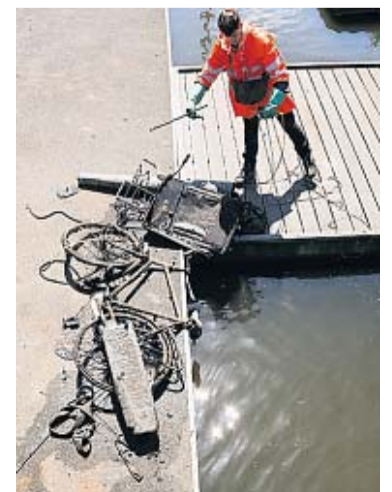
Grachten en fietsen, ze kunnen niet zonder elkaar.