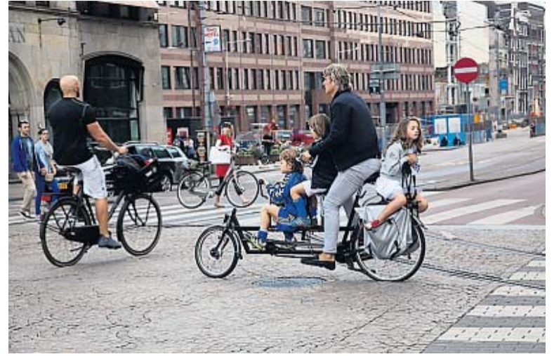
Eén vader met drie kinderen.

In Nederland is het bijna altijd zonnig en warm. Het regent, stormt of vriest er bijna nooit. Tenminste zo lijkt het in het als een echt promotieboek geschreven en gefotografeerde boek van de Amerikaanse Shirley Agudo.