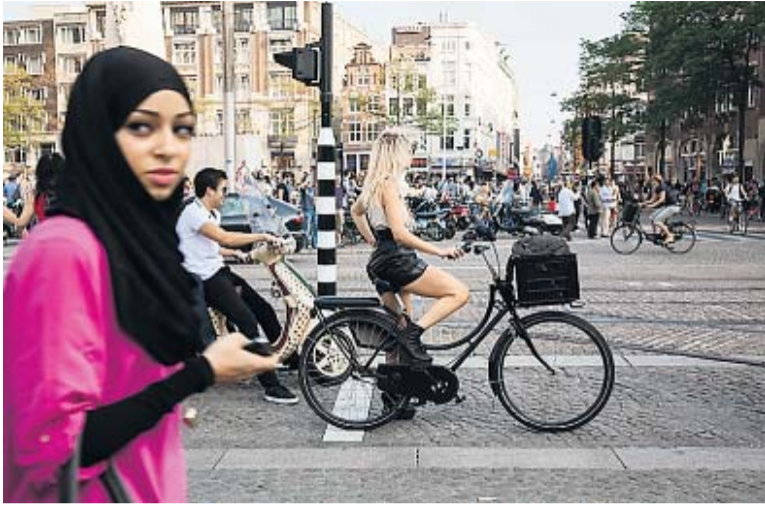
Fietsen heeft natuurlijk niet in de laatste plaats met benen te maken.