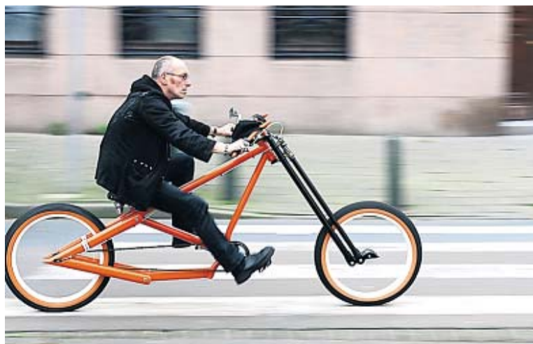
Uitzonderlijke ontwerpen. De fiets werd een designding.