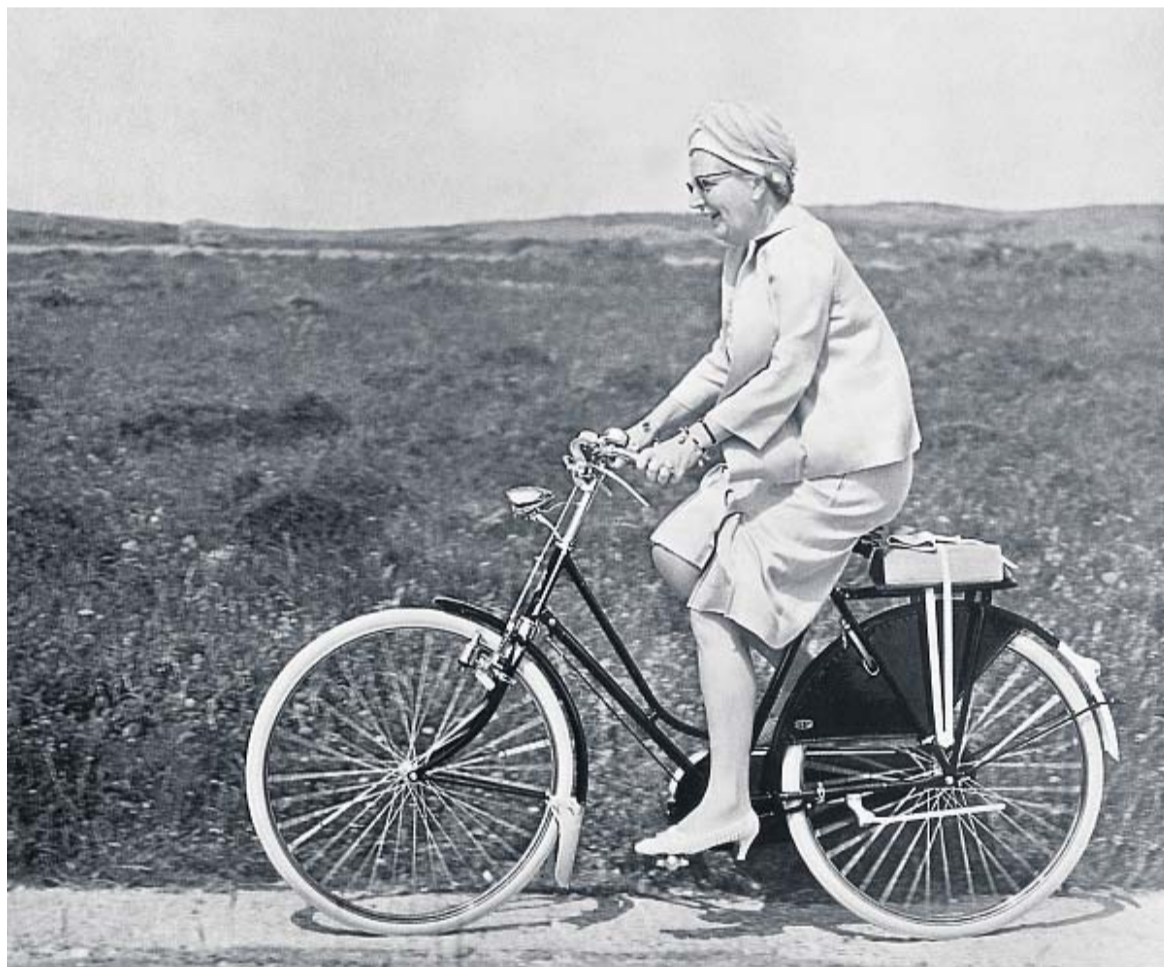
De vroegere koningin Juliana op de fiets op Schiermonnikoog.