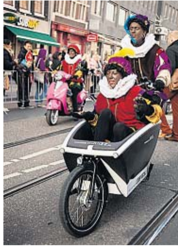
Zwarte pieten op een bakfiets.