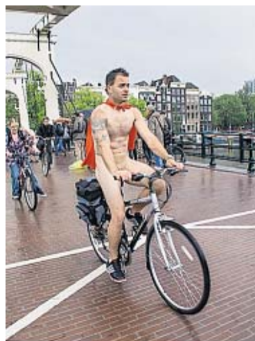
De fietsende Nederlander kijkt met zo'n blik van: 'Raar, moi?'

Shirley Agudo - The Dutch & their bikes Scriptum publishers/Xpat.nl, Schiedam, Engelstalig, 352 blz., 29,90 euro